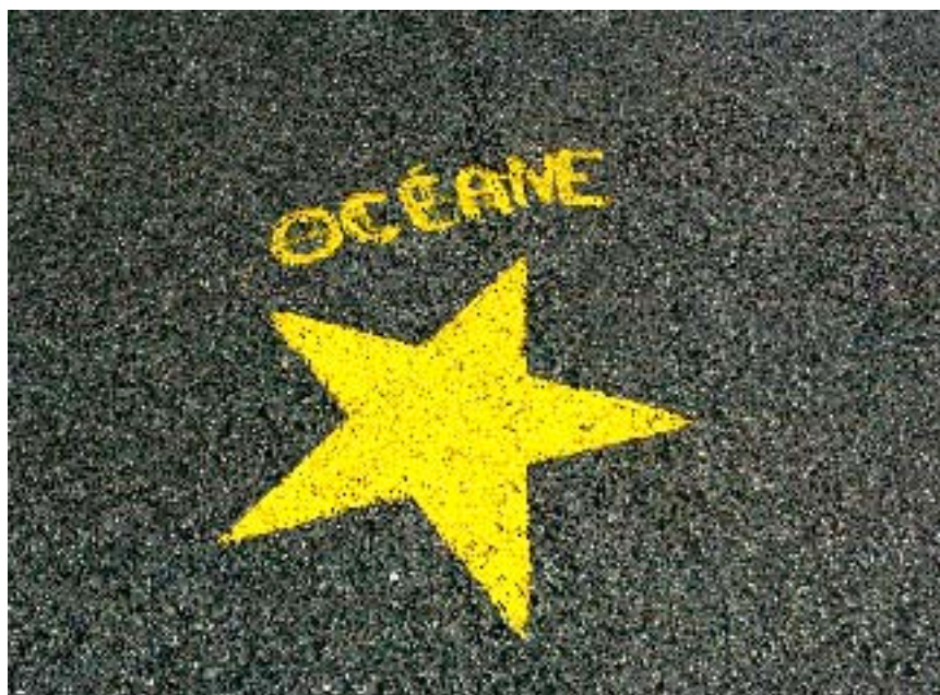
Une étoile pour Océane!

J'ai une appréciation nuancée de ce spectacle car il y avait des scènes qui étaient bien, d'autres très bien, d'autre moins et, enfin,