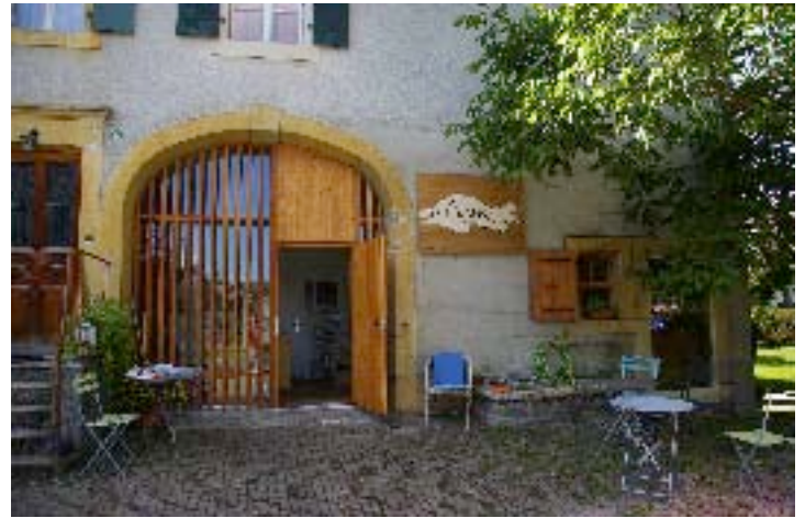
La Grange aux Livres

certaines vulgaires qui n'étaient pas appropriées et où je ne me sentais pas à l'aise. Je crois que je n'étais pas la seule.