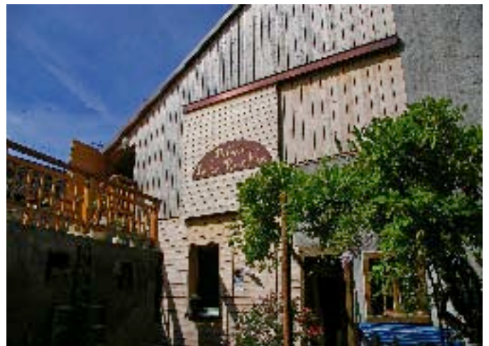
Le “Théâtre de la Ruelle”

Dans ce petit village, on est allé vers une jolie maison, une ancienne ferme transformée et rénovée. Au grenier se trouve une belle petite salle de spectacle, le “Théâtre de la Ruelle”. Un théâtre très simple, des sièges avec des petits coussins brodés que des personnes ont offerts au théâtre.