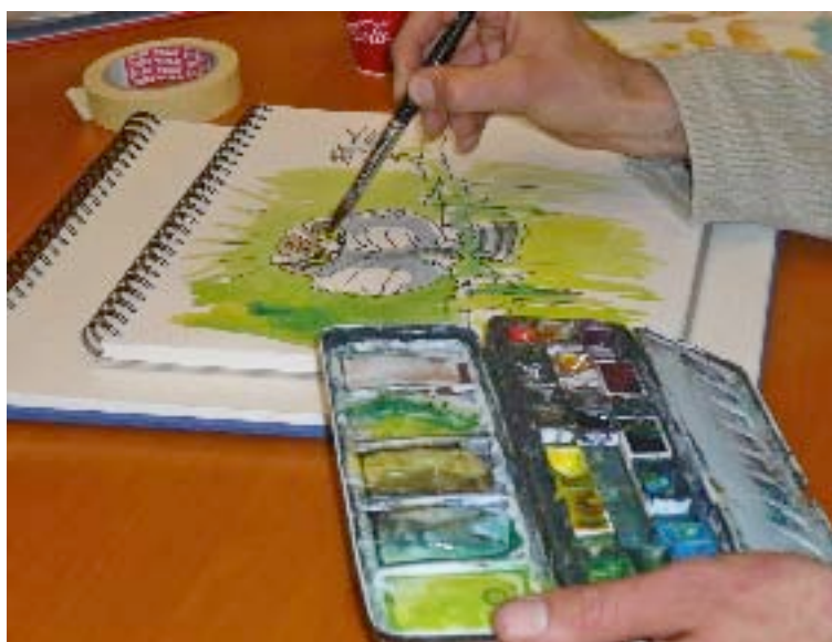
La mésange charbonnière prend forme!