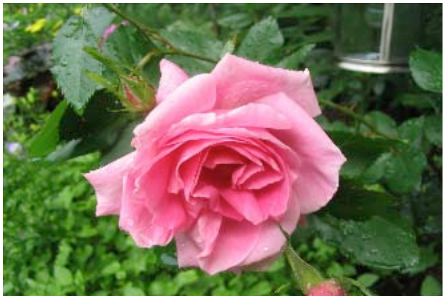
Les parfums des roses enivrent le parc