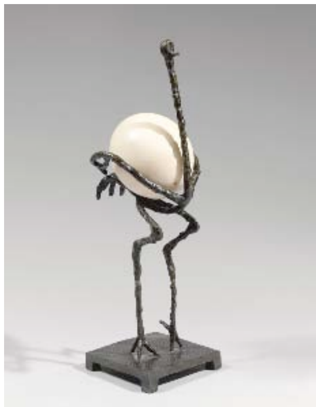
La célèbre autruche