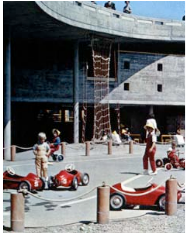
Affiche du spectacle

Le postier demanda de payer, mais grand-maman n'avait pas pris d'argent: le paquet devait donc rester à la poste.