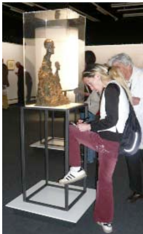
Position inconfortable pour la prise de notes

Giovanni, le père a été un des artistes les plus connus de notre pays au début du 20 e siècle, et cela jusqu'à sa mort en 1933.