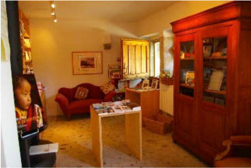
Intérieur accueillant de la librairie

La “Grange aux Livres” a été ouverte en juin 2007. Cette librairie-café propose des oeuvres d’auteurs romans, des récits de voyage et d’exil, ainsi que des livres choisis selon les coups de coeur de Cosette et de ses ami(e)s.