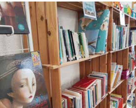
La Bibliothèque de Lire et Ecrire Nord Vaud, à l'Espace Traits d'Union

167 inscriptions 1319 heures de cours 6569 heures-apprenants