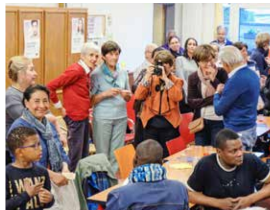
Belle animation lors de la fête de l'antenne