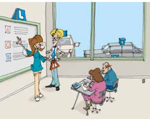
Pascal Fessler – « Cours permis de conduire »