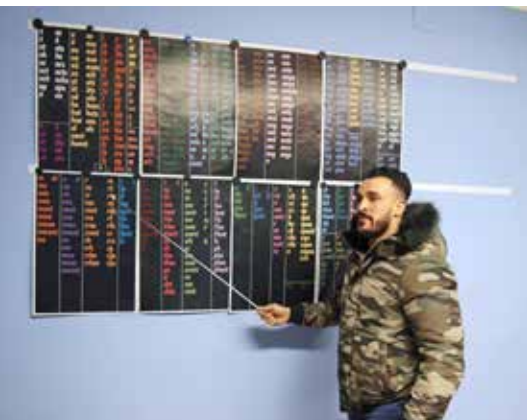
Apprenant d'un cours alpha avec le Fidel

5510 heures de cours 33 246 heures-apprenants 50 cours