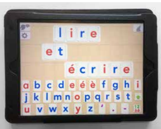
La magie des mots, une des applications utilisée dans le cours d'alphabétisation

756 heures de cours 3695 heures-apprenants 10 cours