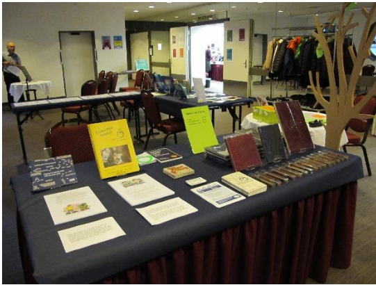
Table 2 et arbre :

Coller sur l'arbre des feuilles où les personnes écrivent