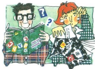
Analphabète, illettré !

Non, ce ne sont pas des injures du capitaine Haddock, mais deux réalités du monde aujourd'hui.