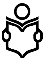
TABLEAU RECAPITULATIF Formation de formateurs Certificat FSEA